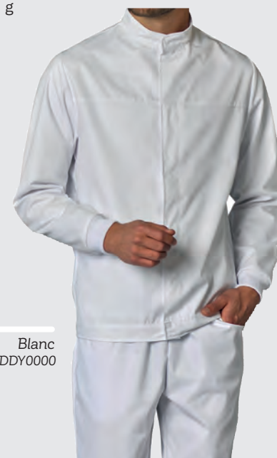
Blanc Ref : FREDDY0000