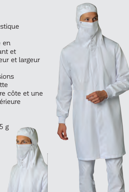
Blanc Ref : NILSBLH00