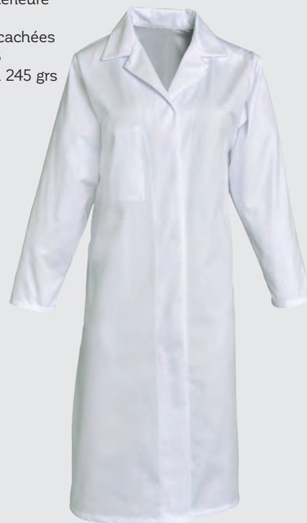
Blanc Ref : CHRLR01300