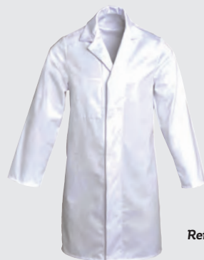
Blanc Ref : CHRLR00300