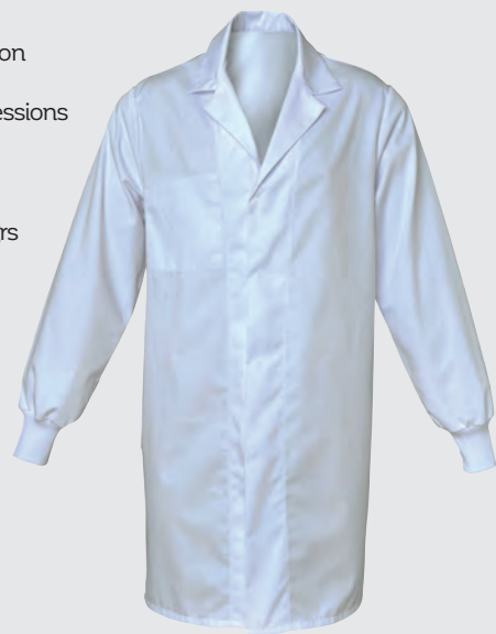
Blanc Ref : SVENMLB00