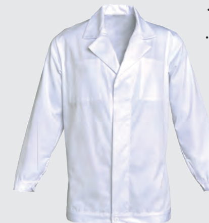
Blanc Ref : NICPR00300