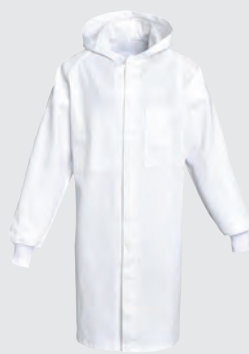
Blanc Ref : HUBLP00A00